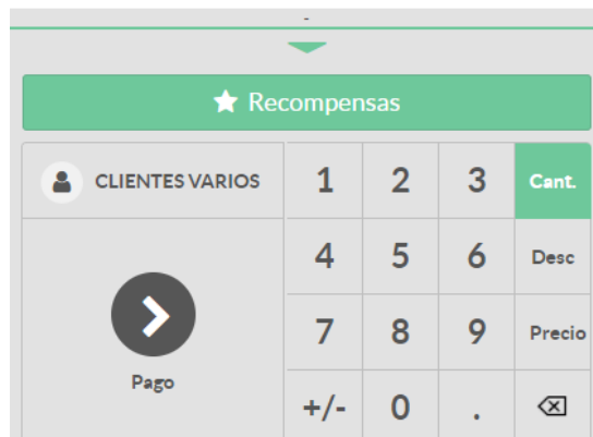
Figura N ° 6: Información de Nota de Crédito