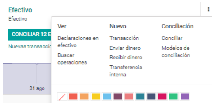
Figura N ° 2: Elección de diario de pago