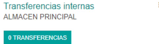
Figura N°1: Tablero Transferencia interna