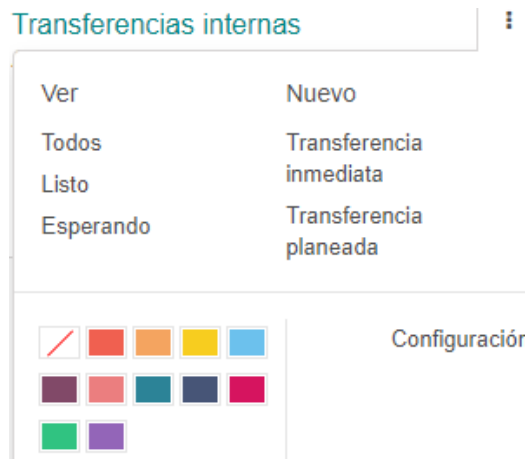
Figura N°2: Menú Transferencias internas