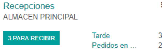
Figura N°1: Tablero Recepciones