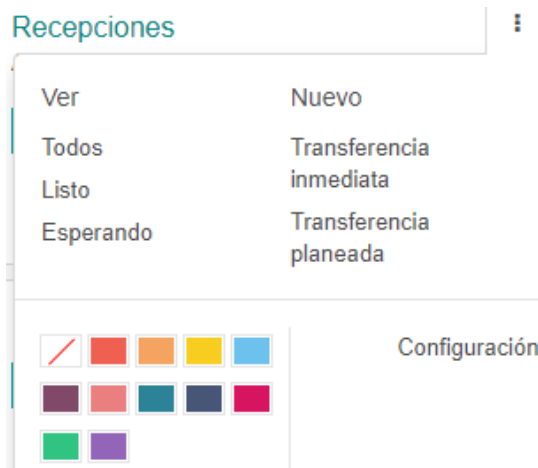
Figura N°2: Menú Recepciones