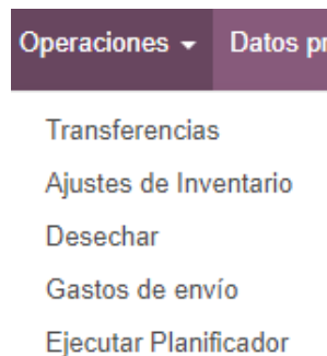
Figura N°2: Opciones del Menú Operaciones